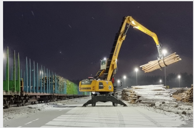
Kuva: Adolf Lahti

Oy Adolf Lahti Yxpila Ab on todellinen puunkäsittelyn ammattilainen. Tänäänkin Adolf Lahti käsittelee raakapuuta satamissa, tehtailla ja terminaaleissa useilla paikkakunnilla aina Kotkasta Pietarsaareen ja ympäri Suomen. Metsäteollisuuden keskittäessä puunhankintaa enemmän kotimaahan myös raakapuun rautatieterminaalien käyttö on lisääntymässä. Vuoden 2023 alusta alkaen Adolf Lahti tulee lastaamaan junanvaunuja kaikkiaan kahdeksassa raakapuutermiinaalissa eri puolella Suomea. Näissä rautatieterminaaleissa tullaan käsittelemään raakapuuta yli neljä miljoonaa kiintokuutiometriä vuosittain. Toiminnan merkittävä kasvu vaatii luonnollisesti myös isoja