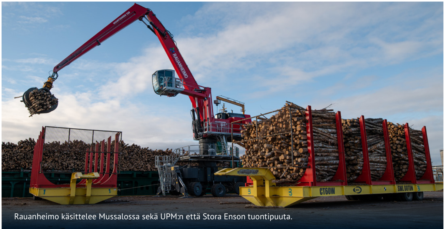
Rauanheimo käsittelee Mussalossa sekä UPM:n että Stora Enson tuontipuuta.