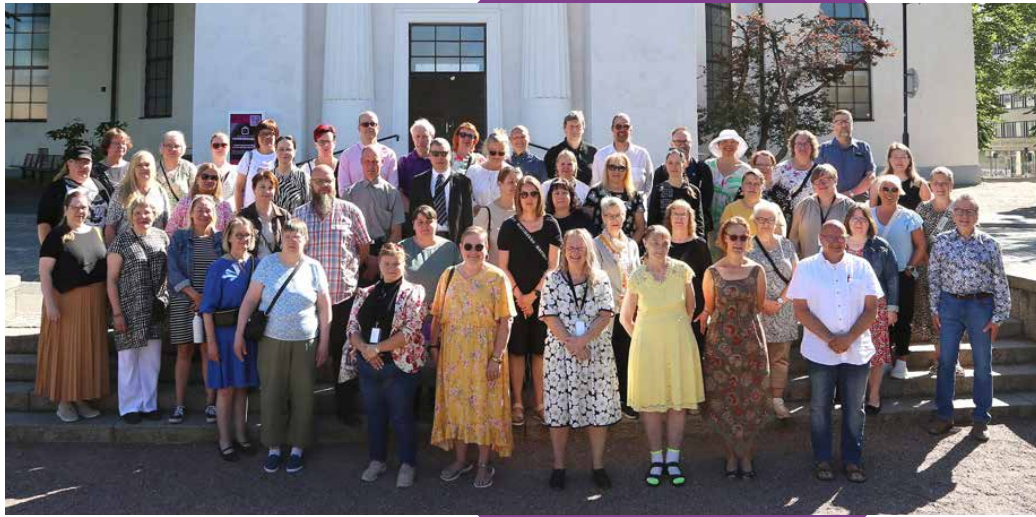
Kirkonpalvelijat Ry 90-vuotispäivät, Hämeenlinna 2024